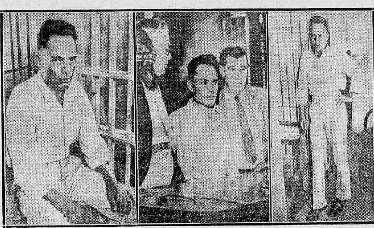
Giuseppe Zangara, que attentou contra a vida do presidente Roosevelt, cujos tiros desfechados ocasionaram a morte do prefeito de Chicago, photographado em tres occasiões; logo após o crime, quando já recolhido à prisão; ao ser interrogado em juizo; e de pé na sua cela. Condemnada à electrocução, Zangara será executado na proxima semana.

Já foram encontrados seis corpos de operarios victimados.